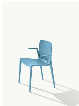
Palau 1021 Sedia monoblocco con braccioli in polipropilene, stampata a iniezione con tecnologia air moulding