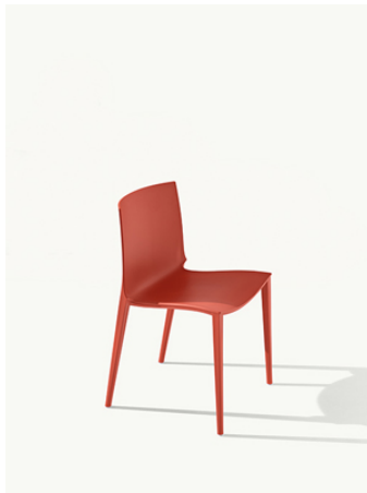
Palau 1020 Sedia monoblocco in polipropilene, stampata a iniezione con tecnologia air moulding

Leggerezza, resistenza e comfort: Palau , la monoblocco disegnata da Marc Sadler , coniuga alla perfezione estetica e funzionalità, prestandosi ad arredare facilmente tutti gli ambienti della collettività, uffici e sale riunioni, locali Food&Beverage, interni ed esterni. Disponibile nella versione sedia monoblocco e nel modello poltroncina , caratterizzata da eleganti braccioli a sbalzo, Palau offre una sensazione di leggerezza al primo sguardo, grazie ad un design pulito e minimale, ma al contempo deciso..